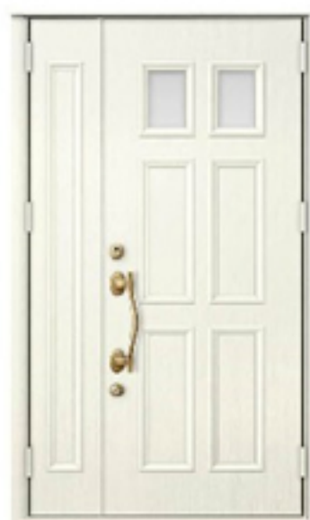
T31型親子 (アスティホワイト)