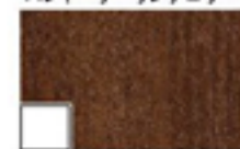
T33型親子 (アスティホワイト)